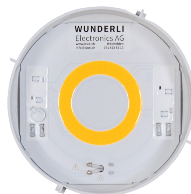
LED Leuchtmittel Einsatz 230V